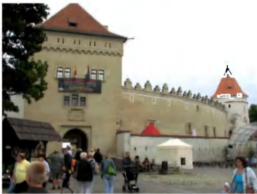
Kežmarský hrad je jediným úplne zachovaným hradom na Spiši.

K zvýšeniu návštevnosti podľa nej prispeli aj viaceré expozície a zaujímavosti, ktoré múzeum v okolí nenájdu. Ide o expozíciu starých automobilov, ktorú plánuje múzeum v tomto roku zatraktívniť a rozšíriť.