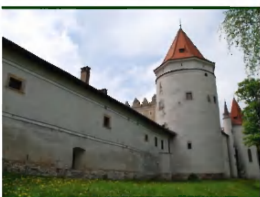
Ocenené Múzeum v Kežmarku ponúka stále expozície v Kežmarskom hrade a aktuálnu výstavu 100. výročia 1. svetovej vojny vo výstavnej sieni v meštianskom dome.